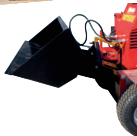
Godet de transport hydraulique

Des accessoires pour votre assistant agile