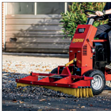
Balai à pousser