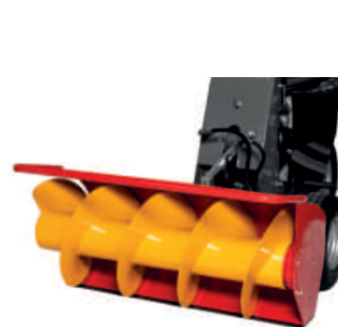
Vis sans fin pour aliments 110 cm