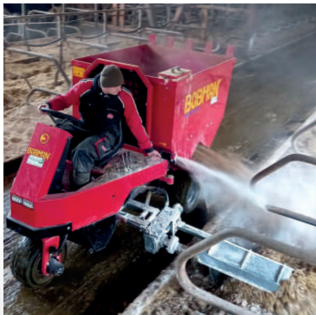
Powerlead Swiss Edition en action

Le Powerlead est le véhicule le plus maniable du marché pour l'épandage avec une trémie de 1'100 litres. Il convient particulièrement aux exploitations laitières avec des boxes profonds. Pour l'épandage de la paille hachée, des pellets, de la sciure, du fumier de séparation. L'appareil complet est entraîné hydrauliquement. Il permet d'épandre et d'ajouter de la chaux, du désinfectant, dans la même étape de travail. La litière dans les logettes sont remise à niveaux et le surplus poussé à l'avant. Sans travail manuel, les logettes sont entretenue. Le Powerlead Swiss Edition peut être équipé d'une vis d'une largeur de 1,0 m ou de 1,2 m, selon l'arceau des logettes.