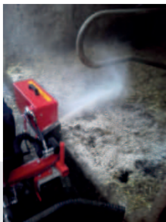
Epandeur de chaux