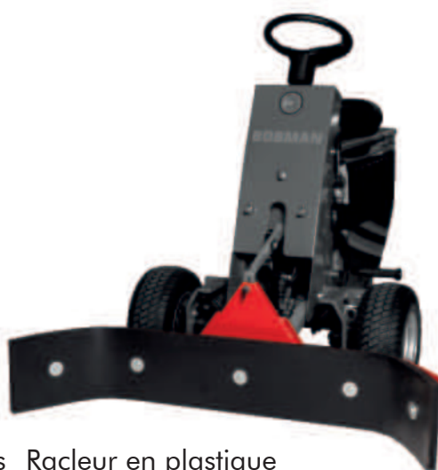
Racleur en plastique 140 cm