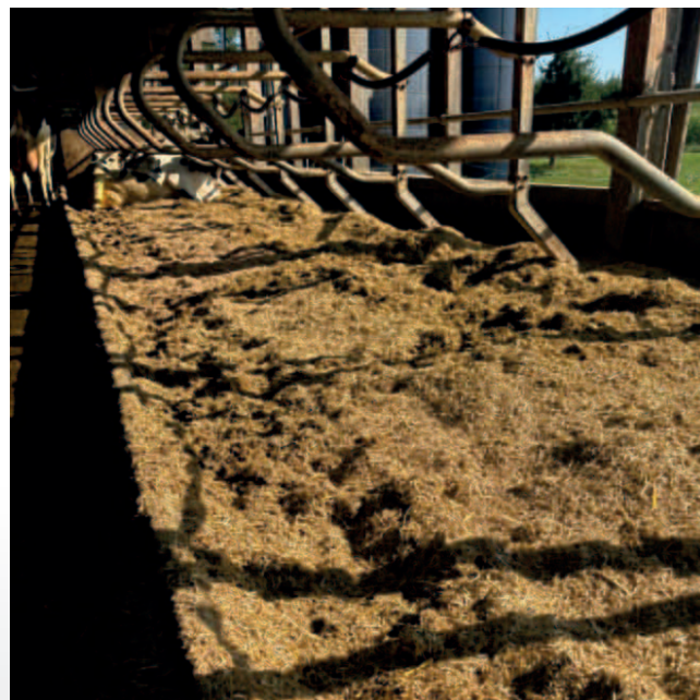
Après le traitement