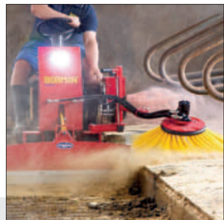
Pousseur court avec balai latéral pour boxes hauts